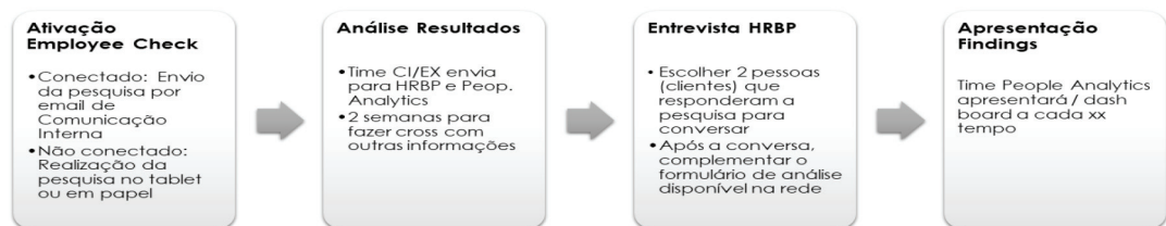
Figura 3: Fluxo do Processo

isso é, como será aplicada a Employee Check , explicado pela figura 3